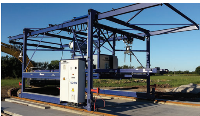
Visão geral da máquina

Weckenmann Anlagentechnik GmbH+Co.KG Birkenstraße 1, 72358 Dormettingen, Alemanha T +49 7427 94930, F +49 7427 949329 info@weckenmann.de , www.weckenmann.com