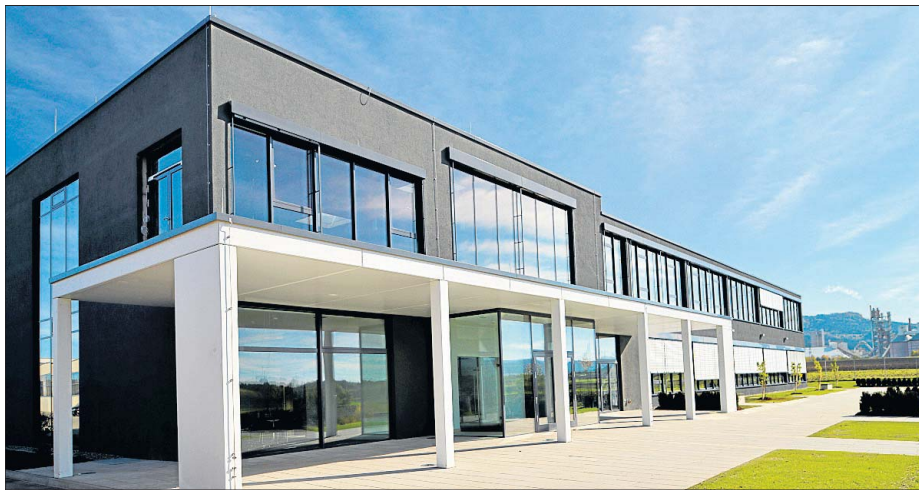
Das neue Vertriebs- und Technologiezentrum der Weckenmann Anlagentechnik prägt den Firmensitz in Dormettingen.