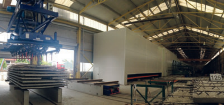
Cuatro puntos de apilado para prelosas armadas con dos carros de salida en funcionamiento semiautomático